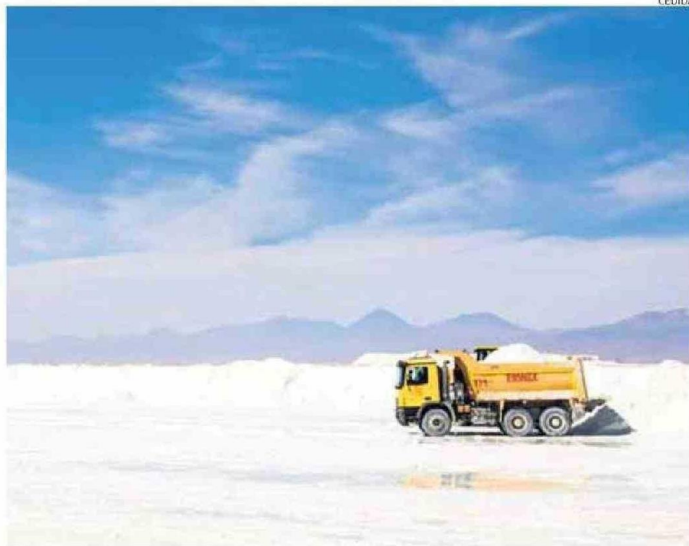
ACTUALMENTE, EN CHILE SE PRODUCE CARBONATO DE LITIO EXCLUSIVAMENTE EN EL SALAR DE ATACAMA.

Respecto del cronograma que cumplirá desde ahora este proceso, desde el Ministerio de Minería precisaron que durante este mes de julio, en conjunto con los otros ministerios involucrados de la Estrategia Nacional del Litio, se desplegarán en