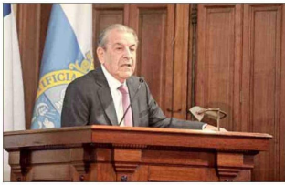
Eduardo Frei (DC), expresidente de la República.

En la presentación del libro “Chile 2050: Un País. Cuatro Presidentes”, organizado por Clapes UC, que se hizo en la sede del BID en Washington, Estados Unidos, este miércoles, estuvieron presentes los exmandatarios Eduardo Frei y Michelle Bachelet.