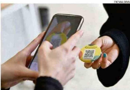
ESTE AÑO LAS CREDENCIALES FUERON CAMBIADAS POR CHAPITAS CON QR.

nes y estar considerados dentro de muchos otros eventos o hitos que internacionalmente se van a promover como lo que ofrece Chile en materia de cultura. El nuestro es un festival que ocurre en Valdivia, pero no