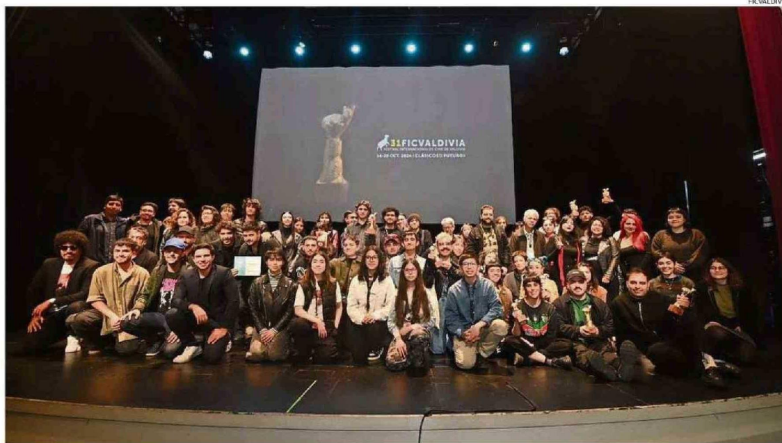
EL SÁBADO Y EN UN GESTO DE UNIÓN, LA PREMIACIÓN FINALIZÓ CON UNA GRAN FOTOGRAFÍA DE TODOS JUNTOS: JURADOS, GANADORES, INVITADOS Y QUIENES NO OBTUVIERON EL PUDÚ.

Además, la obtención de financiamiento por parte del Gobierno Regional de Los Ríos no fructificó como se esperaba. Aunque se mantuvo el apoyo de la Municipalidad de Valdivia y del Ministerio de las Culturas;