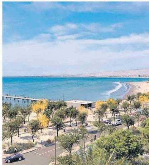
UNIFICARÁN MÁS DE 45 MIL METROS CUADRADOS.

Si bien es un proyecto multisectorial, en el que se involucran diversos actores públicos y privados, esta iniciativa es impulsada por el gobierno regional, en conjunto con el Minis-