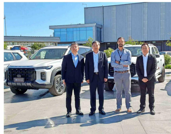
Ejecutivos de Maxus visitan el centro de distribución de Andes Motor y Grupo Kaufmann.