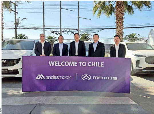
Ejecutivos de Maxus y Andes Motor suscriben la renovación de la representación.