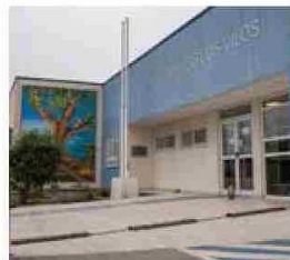
En materia de salud, en el marco de Somos Choapa se realizó el Centro de Diálisis de Los Vilos, la Posta de Salud Rural de Limahuida en Illapel, y el CESFAM de Valle Alto en Salamanca.

“Ha sido una mejora enorme para la comunidad y los profesionales que trabajamos acá. El hecho de tener una posta de primer nivel es algo muy positivo para la gente”.