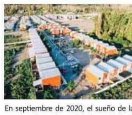
En septiembre de 2020, el sueño de la casa propia se hizo realidad para 50 familias de Salamanca. El proyecto contó con el diseño de la oficina de arquitectos Elemental, en el marco de Somos Choapa.

“Fue un proceso de más de 15 años, una lucha larga y compleja, donde hubo momentos de altos y bajos, pero al final logramos concretar este proyecto. En este proceso hay varios actores involucrados, que si no hubiésemos trabajado en conjunto no se habría podido concretar este sueño”.