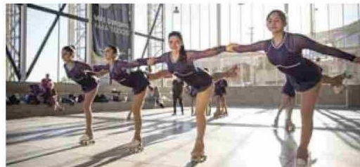
La infraestructura deportiva ha sido uno de los ejes del programa, destacando los estadios y centros comunitarios como El Polígono de Illapel.