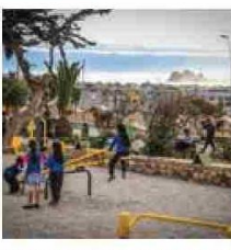
40 nuevas plazas se construyeron en la provincia a través de un proceso participativo donde los vecinos fueron protagonistas.