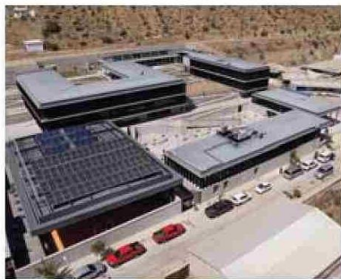
La recién inaugurada Escuela de Canela Alta cuenta con un diseño moderno y funcional para recibir a más de 400 alumnos.

En esa línea y tras el inicio del nuevo ciclo de gestión municipal 2024-2028, la compañía ha manifestado su voluntad de seguir trabajando de manera conjunta para mejorar la calidad de vida de sus vecinos y vecinas, manteniendo el foco provincial y la colaboración público-privada.