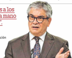
MARIO MARCEL Ministro de Hacienda habló sobre la remoción del jefe del SEA nortino que rechazó millonario proyecto de Colbún en Taltal.

"A veces hay funcionarios a los que se les pasa un poco la mano en estos procedimientos".