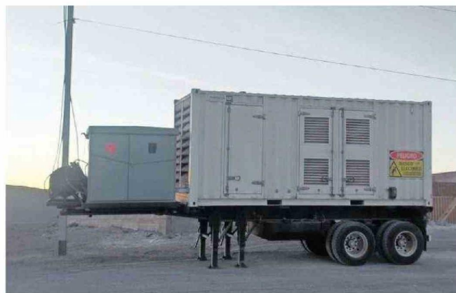
AYER POR LA MAÑANA SE LOGRÓ INSTALAR EL GENERADOR ELÉCTRICO A LA ESPERA DE LA REPOSICIÓN TOTAL.

Ayer y desde temprano equipos técnicos efectuaron trabajos para entregar energía de forma parcial, desde las 7 de la mañana y hasta la medianoche en el poblado y en el valle de Lasana. "Nuestra municipalidad al tomar conocimiento del robo de cables y los daños a la postación, ofició a la Delegación Presidencial para atender al corte de suministro eléctrico, y se hicieron gestiones con la empresa a cargo del suministro, para la instalación de un generador en las comunidades afectadas, y también las gestiones para subsanar el problema. Y siendo las 11.36 de la mañana, CGE informó que están los generadores con el respaldo suficiente para los vecinos de Chiu Chiu y Lasana. Además, el municipio está coordinando la acción de poder reprogramar el trabajo de los camiones aljibes para poder proveer la entrega de agua po-