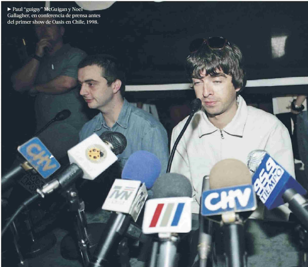
► Paul "guigsy" McGuigan y Noel Gallagher, en conferencia de prensa antes del primer show de Oasis en Chile, 1998.

presión que le dejó Noel tras conocerlo en esa experiencia de 2006. "Fue muy amable porque como que uno tiene, o sea, como que él públicamente tiene una imagen de cascarrabias y era todo lo contrario: era como muy caballero. Estaba todo el rato muy pendiente de '¿oye, se quieren servir algo?' y todo el rato fue puro hablar de música. En el camarín tenían puesto un disco de una banda que a nosotros nos gusta mucho que se llama The Kinks y era una sesión en la BBC".