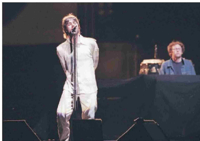
▲ Liam Gallagher, en el show de Oasis en San Carlos de Apoquindo, 1998.

el sábado 14). "No sé dónde está. Debe estar preso. Y si no, les aseguro que en seis meses sí que lo estará". Luego remató en su estilo: "Liam es un pollo loco".