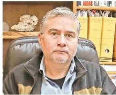
Mauricio Ruíz, director regional de Conaf.

HYST manifestó su profunda preocupación tras detectar esta significativa diferencia en los registros de visitantes, obtenidos a través de la Ley de Transparencia. En enero de 2025, la asociación solicitó información detallada que incluyera la nacionalidad de cada visitante, pero la respuesta inicial no cumplió con el nivel de detalle requerido. Un segundo informe evidenció una brecha de casi 40 mil visitantes entre los datos entregados por Conaf, expresó su malestar ante la situación: