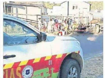
FUNCIONARIOS MUNICIPALES DEBIERON ATENDER DIVERSAS EMERGENCIAS DE SUS VECINOS.