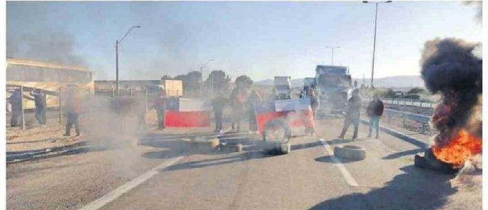
LOS PESCADORES ASEGURARON QUE PODRÍAN VOLVER A TOMARSE LOS CAMINOS.

Quizá a la Asamblea General de 2030, desde Atacama vaya una delegación de científicos que pudieran cumplir su anhelo de formación e investigación astronómica íntegramente en la región.