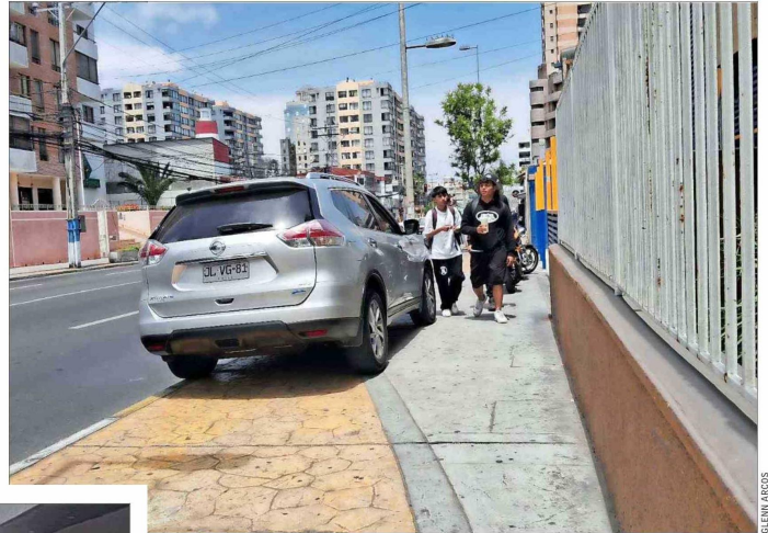
ANTOFAGASTA.— Como algo aparentemente ya normalizado, a diario se observa un alto número de autos mal estacionados en esta ciudad.

peatones. Debido a la escasa fiscalización, las personas que hacen uso de vehículos motorizados se estacionan en cualquier lugar, incluyendo en lugares reservados para personas con discapacidad”, dice.