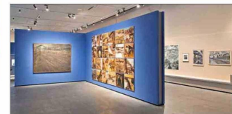
"Por la línea corre el tren" se podrá visitar hasta las 21:00 horas y con entrada gratuita en el CCLM.