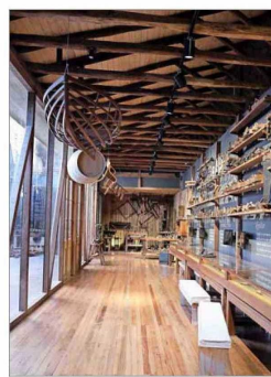
Museo Taller , en el barrio Yungay, brindará la posibilidad de aprender haciendo.