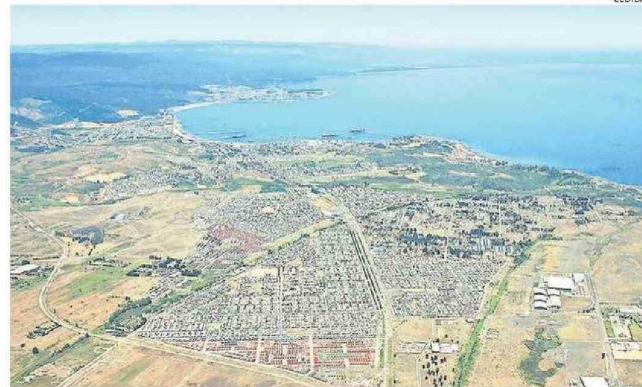
LA COMUNA ES UNA DE LAS MÁS COMPLEJAS CON LA PROBLEMÁTICA EN MATERIA DE ESCASEZ HÍDRICA.

Al ser consultado sobre cómo se confirma la presencia de la mano del hombre en este problema, el experto indicó que “si bien, el hierro total y manganeso total se encuentran de forma natural en el acuífero, hay otro factor en el cual se adicionan ya estos metales por actividad industrial. La zona sur del acuífero Coronel está bajo una zona altamente industrial (...) en momentos, por ejemplo, de lluvia, ésta es ca-