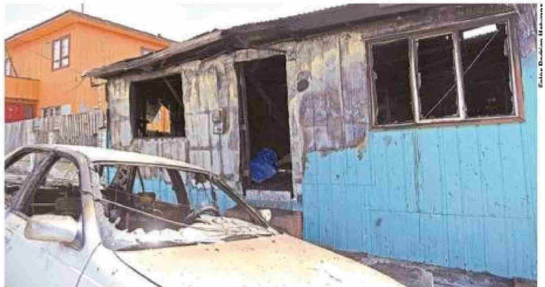
Totalmente consumida resultó esta vivienda y el vehículo también resultó con daños. Labocar se constituyó en el lugar para realizar las pericias del incendio.

Por instrucción de la Fiscalía Regional, Carabineros se dirigió