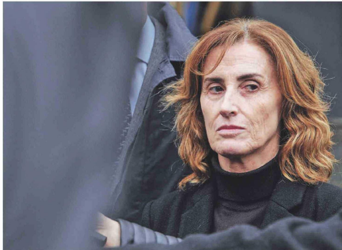
Una bomba le explotó a la candidata Marcela Cubillos un mes antes de las elecciones.

universidad. Le financiaban la campaña, es la lectura de una de las fuentes". Tanto revuelo causó el asunto -entre otras cosas, porque la USS recibe financiamiento estatal- que ayer la Superintendencia de Educación Superior (SES) ofició a la institución para que entregue respaldos por el alto sueldo de Marcela Cubillos. La idea de la Súper es comprobar que la exministra de Educación haya efectivamente hecho las clases y las investigaciones comprometidas con la USS. La SES le pidió a la USS -fundada en 1989 en Concepción y cuyo presidente de la Junta Directiva es Andrés Chadwick- "que informe y circunscriba estos hechos de público conocimiento y ponga a su disposición los antecedentes de respaldo en un plazo máximo de cinco días hábiles". Paralelamente, la SES recibió otras denuncias relacionadas con este mismo asunto, que estaban en proceso de revisión para determinar su admisibilidad. Un rato antes de esta decisión de la SES, la exministra de Medio Ambiente y también exconvencional constituyente, entregó su versión del hecho a los medios, explicando que tales funciones las cumplió desde 2020 hasta