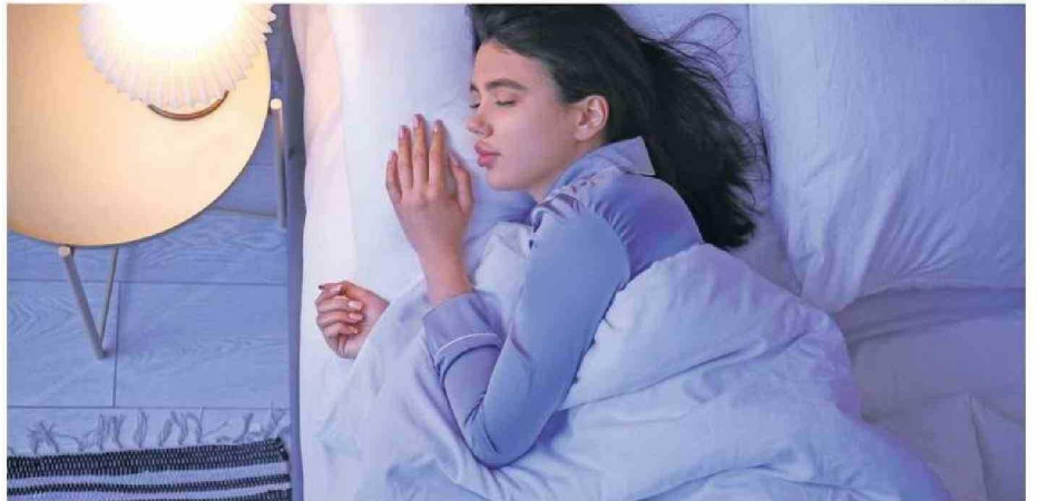
LA CIENCIA CONFIRMÓ EL EFECTO REPARADOR QUE TIENE UN SUEÑO PROFUNDO.

Aunque los ratones tratados con zolpidem se dormían más rápido, el transporte de fluidos al cerebro