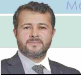
Alcalde de Melipeuco, Alejandro Cuminao