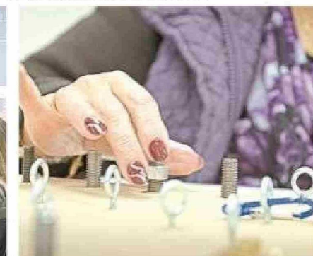
Las mujeres de entre 30 y 64 años son las más afectadas con la alta prevalencia del Long Covid en Magallanes.

Cadi-Umag: Una historia de lucha contra el Covid-19 desde el diagnóstico hasta la rehabilitación