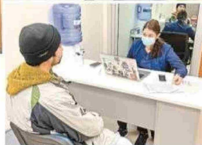
Fueron 292 personas las que participaron en el estudio financiado por el Fic-R.

pero tenemos que integrar nuevos recursos. Este es el primer estudio nacional que se hace desde la región. Por eso deberíamos presentarlo al Ministerio, hacer evaluaciones mayores y poder redirigir especialmente al fortalecimiento de la atención en salud mental y la rehabilitación músculo-esquelética, dos de los focos principales identificados por el estudio.