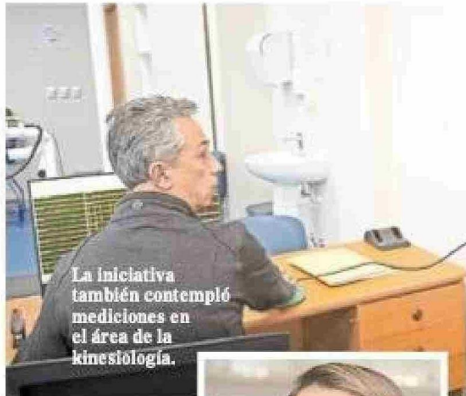
La iniciativa también contempló mediciones en el área de la kinesiología.