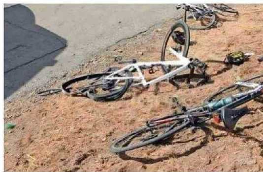
MOUAT TRANSITABA CON AMIGOS EN BICICLETA POR LA RUTA 5 A LA ALTURA DE PADRE LAS CASAS.

Mouat además destacaba por sus amplias capacidades en odontología y medicina estética, atendiendo a miles de usuarios