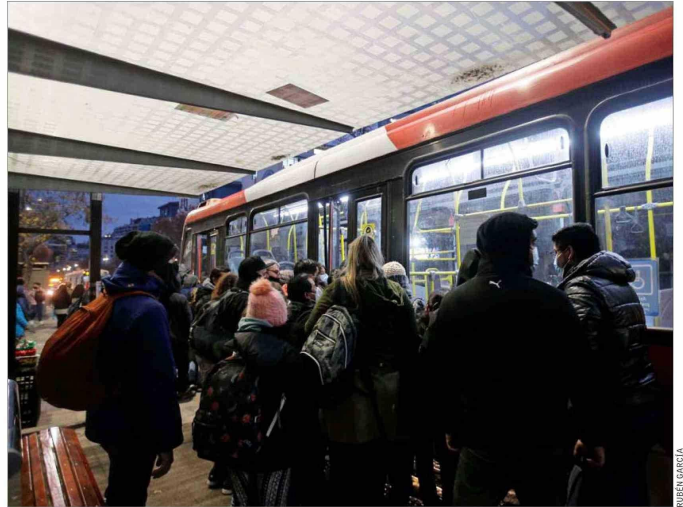
HORA DE TRASLADOS. — Aunque equidistantes al centro de Santiago, el 24% de los usuarios en San Bernardo inician sus viajes entre las 4:00 y 7:00 horas, mientras que en Lo Barnechea lo hace el 9%.

“En efecto, las variables socioeconómicas parecen jugar un rol más importante incluso que la distancia entre sectores habitacionales y localización