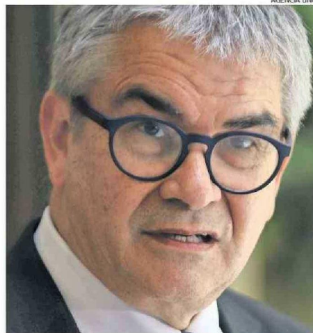
“SALUD ES LO MÁS DESAFIANTE QUE HAY EN TODO EL PRESUPUESTO NACIONAL”.

Marcel agregó que “se está trabajando con el Minsal para que los recursos que se aportan lleguen a donde realmente se necesitan. Hay recursos adicionales que se van a entregar para cerrar el año, pero en el contexto