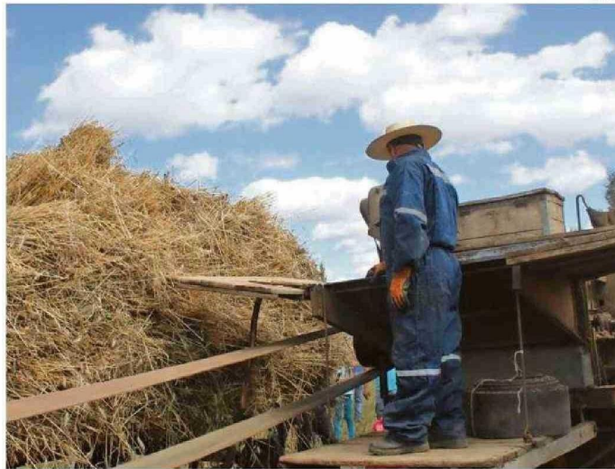
TRIGUEROS DE EL CARMEN ACUSAN BAJOS PRECIOS DE COMPRA DE SU PRODUCCIÓN.

El alcalde carmelino apunta a que Cotrisa, institución que tendría actuar en el mercado para poder comprar por cuenta del Estado los cereales, es quien debiera dar cumplimiento al tema de los pre-