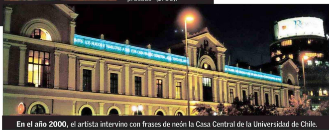
En el año 2000, el artista intervino con frases de neón la Casa Central de la Universidad de Chile.