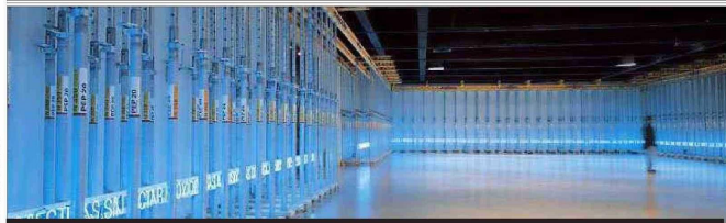
"Unidos en la gloria y en la muerte" (1997), en el MNBA.