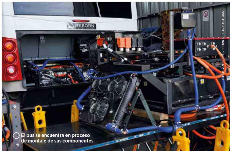
El bus se encuentra en proceso de montaje de sus componentes.