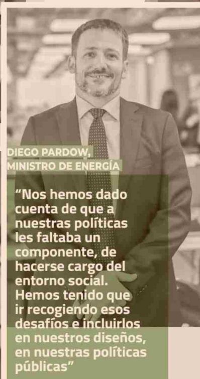
DIEGO PARDOW, MINISTRO DE ENERGÍA

"El desafío hoy, junto con esta mejora de productividad, tiene que ver con cómo minimizamos, reducimos, nuestros impactos y generamos legitimidad socioambiental. En minería eso es lo clave"