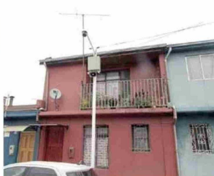
Cámaras de televidencia para pasajes y calles de Población Caupolicán, un logro que trae tranquilidad al sector.