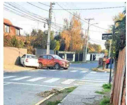
La intersección de Merino Jarpa y Membrillar, se ha transformado en la "esquina del peligro".