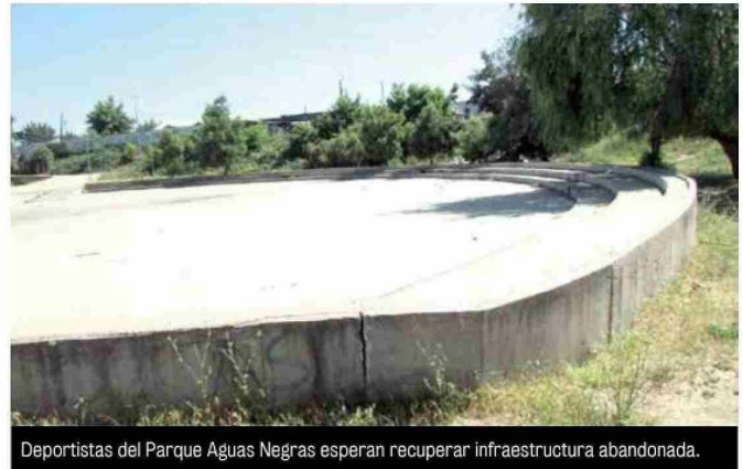
Deportistas del Parque Aguas Negras esperan recuperar infraestructura abandonada.