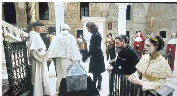
El rey Canuto, de rodillas, ante el Papa.

Realidad. "La enemistad de Harald con los daneses y el rey Canuto lo terminó desviando a tierras eslavas y bizantinas desde los 15 años. Un año después, en 1031, llegó a Kíevan Rus (la actual Kiev), donde Harald y sus hombres fueron recibidos por el gran príncipe Yaroslav el Sabio. Se supone que Harald huyó cuando Yaroslav se enteró que su hija y el vikingo mantenían una relación. Harald atravesó con sus hombres Ucrania y el mar Negro hasta llegar a Bizancio, donde se alistó en la guardia varega, una unidad integrada por mercenarios suecos, daneses, noruegos e islandeses. Tras sus victoriosas campañas en el norte de África, Siria, Palestina, Jerusalén y Sicilia, Harald amasó una inmensa fortuna personal procedente del saqueo. En el año 1038 se unió a una expedición bizantina para reconquistar Sicilia a los sarracenos, los cuales habían establecido allí un emirato en el año 965. Las sagas nórdicas cuentan que Harald y sus hombres lograron capturar cuatro ciudades sicilianas hasta 1041, año en que la expedición terminó". Patricio Zamora, historiador.