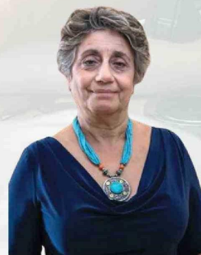
Jessica López Ministra de Obras Públicas

"Es necesario contar con soluciones adaptadas a cada región", comenta López,