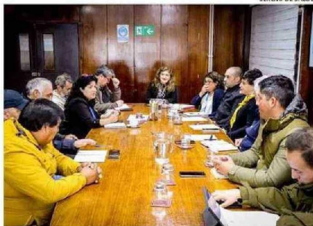
EN EL SALÓN DEL MUNICIPIO DE QUELLÓN FUE LA SESIÓN DE LA MESA DE MAREA ROJA.