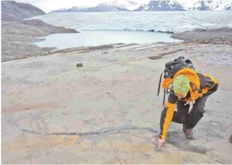
La zona del hallazgo del fósil en Torres del Paine.