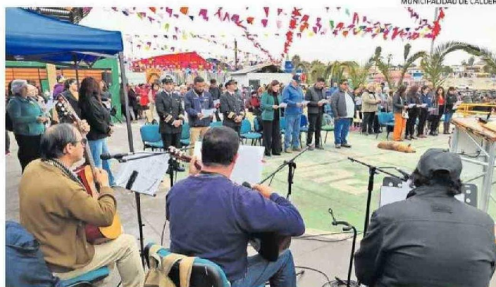
CALDERA TENDRÁ HOY LA BENDICIÓN A LOS PESCADORES LANCHAS Y AL MAR.

con una procesión al muelle de pescadores de la comuna de Caldera.