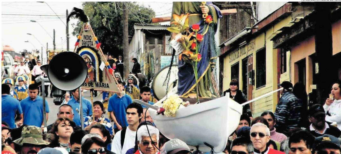
EN HUASCO SE LLEVAN A CABO ACTIVIDADES DURANTE TODO EL FIN DE SEMANA, CON PROCESIONES, BAILES RELIGIOSOS, CÁNTICOS, ADEMÁS DE LA FERIA COMERCIAL QUE SE DA EN LA COMUNA Y QUE REÚNE A VISITANTES.