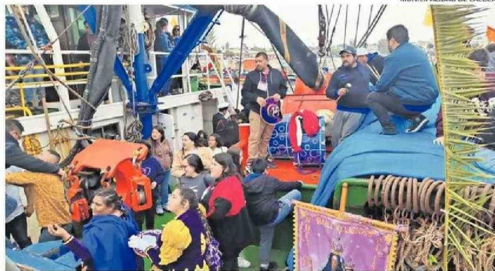
COMUNA DE CALDERA HOY TENDRÁ DIVERSAS ACTIVIDADES.

Ayer se realizó la procesión al templo parroquia del santo, instancia que culminó