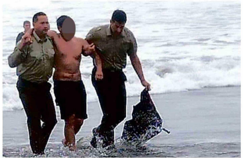
CARABINEROS QUE LLEGARON A COLABORAR EN LA EMERGENCIA AYUDARON A SALIR AL PRIMERO DE LOS JÓVENES BAÑISTAS.

Con la llegada simultánea de los equipos de rescate marítimo de la Armada al lugar se determinó que, debido a las condicio-