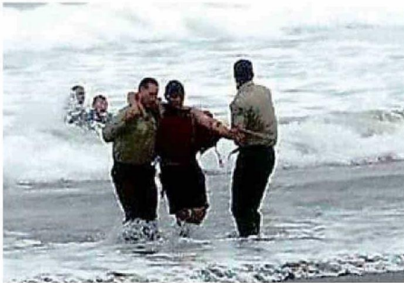
EL RESCATE CAUSÓ EXPECTACIÓN EN LA PLAYA DE SANTO DOMINGO.

Los amigos se bañaban en sector no habilitado al momento de la emergencia. Minutos de tensión se vivieron en el operativo de salvataje.