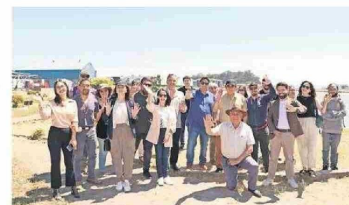
Talcahuano ya cuenta con su primer humedal urbano, el Redamo y Redacamo. Su declaración se concretó hace una semana.