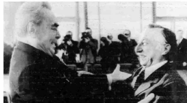
Luis Corvalán , secretario general del PC chileno, es recibido en Moscú por el secretario general del PC de la URSS, Leonid Brézhnev.