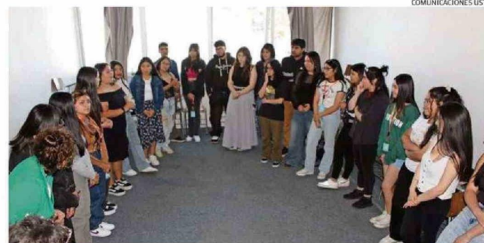
LOS ESTUDIANTES DE PRIMER AÑO DE LA U. SANTO TOMÁS TUVIERON UNA SERIE DE ACTIVIDADES DE INTEGRACIÓN.