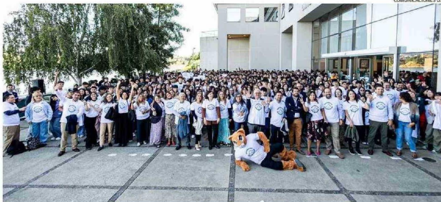
EN LA SEDE VALDIVIA DE LA UNIVERSIDAD SAN SEBASTIÁN, EL MARTES 25 COMENZARON LAS ACTIVIDADES DE RECEPCIÓN PARA LOS NUEVOS ESTUDIANTES.

De esta manera, se realizó la Feria MiUSS, un espacio interactivo donde para conocer los servicios y beneficios institucionales, explorar la oferta de talleres extracurriculares y disfrutar de actividades recreativas y música en vivo. El miércoles fue el turno de la ceremonia de bienvenida para padres, quienes co-