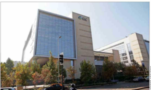
Clínica Las Condes arrastra una situación financiera compleja. Ha debido realizar un aumento de capital y enajenar activos inmobiliarios.