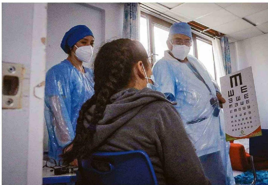
OFTALMOLOGÍA ES UNA DE LAS ÁREAS DONDE SE CONCENTRA EL DÉFICIT DE ESPECIALISTAS.

Para Luis Ignacio de la Torre, presidente del Colegio Médico de Valparaíso (Colmed), llama la atención que "hay especialidades que concentran importan-