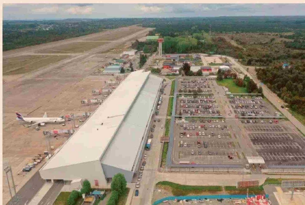
El Tepual, en Puerto Montt, es la puerta de acceso del tráfico aéreo para con la zona sur del Chile