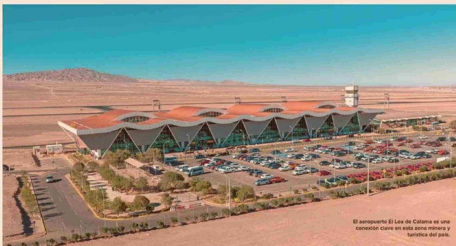
El aeropuerto El Loa de Calama es una conexión clave en esta zona minera y turística del país.

El inicio de la segunda concesión del aeropuerto de Copiapó, en la comuna de Caldera, considera el aumento de la superficie del terminal de pasajeros, quintuplicando el tamaño de la actual terminal. El proyecto incluye la incorporación nuevos puentes de embarque, estacionamientos para aeronaves comerciales,