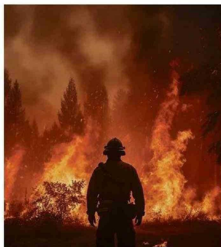
GRANDES INCENDIOS FORESTALES SON FRECUENTES EN TIEMPOS DE VERANO, CAUSANDO CONTAMINACIÓN AMBIENTAL.