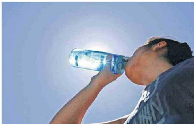
LA HIDRATACIÓN CONSTANTE ES UNA DE LAS RECOMENDACIONES MÁS IMPORTANTES PARA ESTA ÉPOCA.

SALUD. Entregan recomendaciones para grupos vulnerables, alimentación, buen dormir, trabajadores, entre otros.