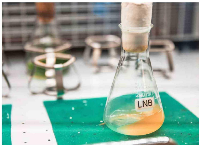
Recipiente de laboratorio con agua residual y E. coli.