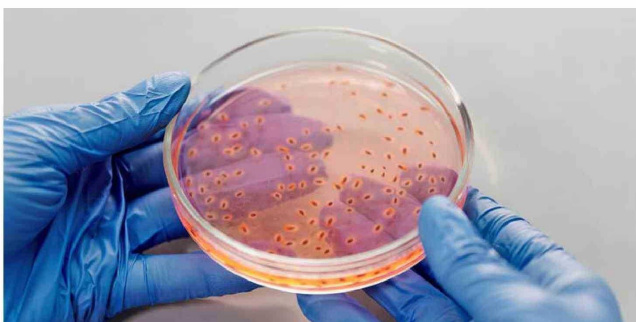
Cultivo microbiológico (ajeno a la investigación del EPFL).