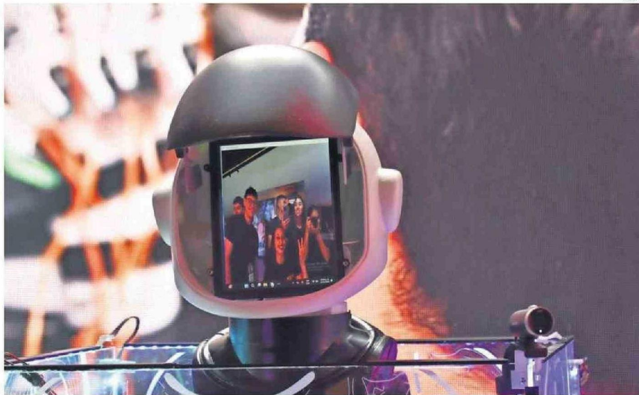
LA CABEZA DE STELARBOT YA ESTÁ LISTA Y SE EXHIBIÓ EN CONGRESO FUTURO 2025. EN EL CASCO SE VERÁ EL ROSTRO DEL USUARIO.

“Ellos nos plantearon el desafío de fabricar un robot personalizado para que pudiera trabajar en el nuevo Centro Espacial”, comenta Gálvez. Su objetivo era que éste fuera el anfitrión de las visitas que lle-