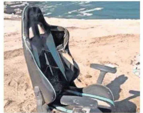
LA PRESENCIA DE BASURA Y DESECHOS EN LA PORTADA.

concreta. Lo complejo de la situación, es que en este sector y lugares aledaños, habitan gran variedad de aves como pelicanos y gaviotas, sumado a la presencia de animales que actualmente están en peligro de extinción, como lo l pingüino de Humboldt y chungungos.