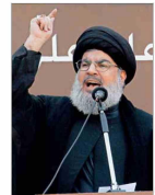
Hasan Nasrallah dirige a la milicia chilita libanesa desde 1992.

Vuelta a casa Colo-Colo vence 2-0 a Cobresal y espera a la UC en su intento por acercarse al líder U. de Chile. | DEPORTES 3