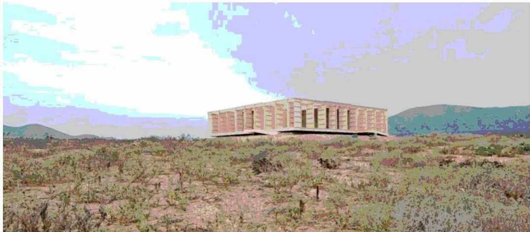
Casa en Morillos, de 175 m 2 , hecha íntegramente en madera de pino sin nudos.