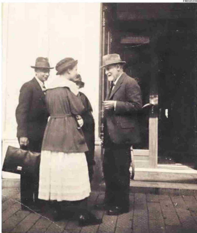
RANK FUE UN DISCÍPULO MUY CERCANO A FREUD, DE QUIEN SE TERMINÓ DISTANCIANDO.