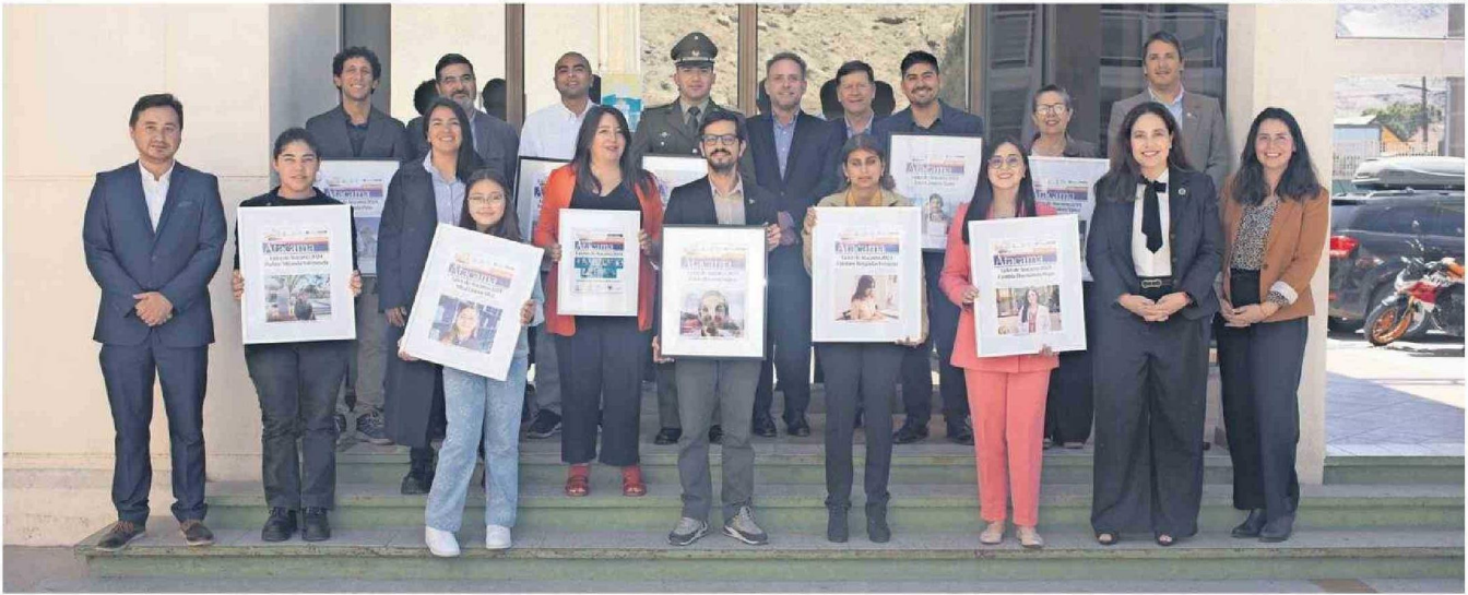
LA CEREMONIA REUNIÓ A LOS DIEZ GALARDONADOS Y SUS FAMILIAS, LOS MIEMBROS DEL JURADO, Y LOS REPRESENTANTES DE LAS EMPRESAS AUSPICIADORAS Y LA UNIVERSIDAD DE ATACAMA, QUE HACEN POSIBLE LA INSTANCIA.