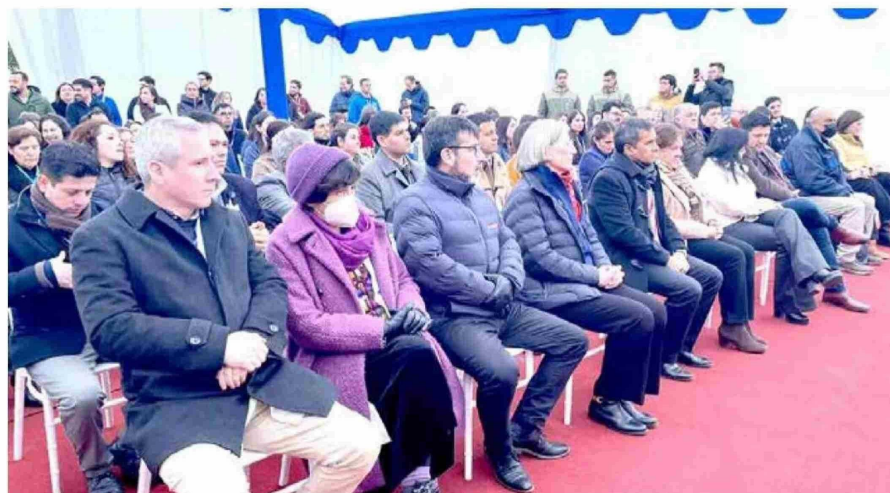
Tanto autoridades del área de salud, como gubernamentales estuvieron presentes.

Cada una de estas secciones contará con una cantidad de profesionales especializados para poder ejecutar los diferentes procedimientos, tanto de radioterapia, como de quimioterapia, lo que facilitará el proceso y podrán ayudar a mejorar a los pacientes en sus tratamientos, tanto de la parte física como la psicológica.