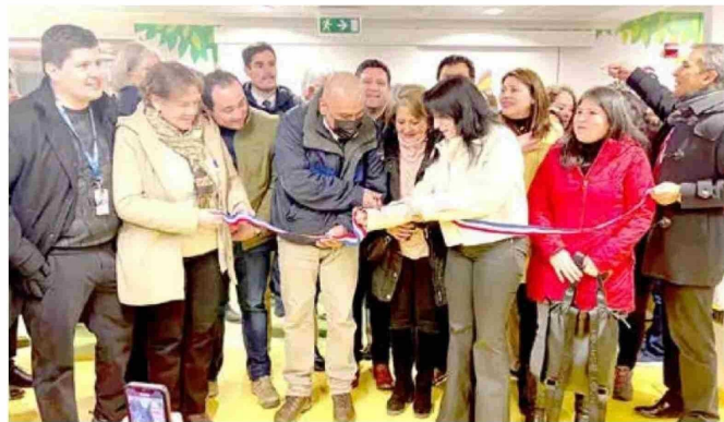
En pleno recinto se realizó el tradicional corte de cinta.

tros es la línea de trabajo que hay que mantener y es un esfuerzo enorme que ha hecho el Gobierno Regional y le enviamos al Consejo Regional los agradecimientos no sólo del Gobierno, sino que también de la ciudadanía”, cerró Aqueveque.